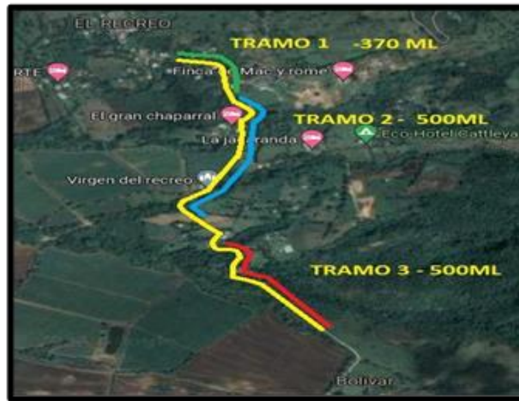
Ilustración 2 Ubicación específica

Está situada en el piedemonte de la Cordillera Central, en el corredor del cambio de pendiente